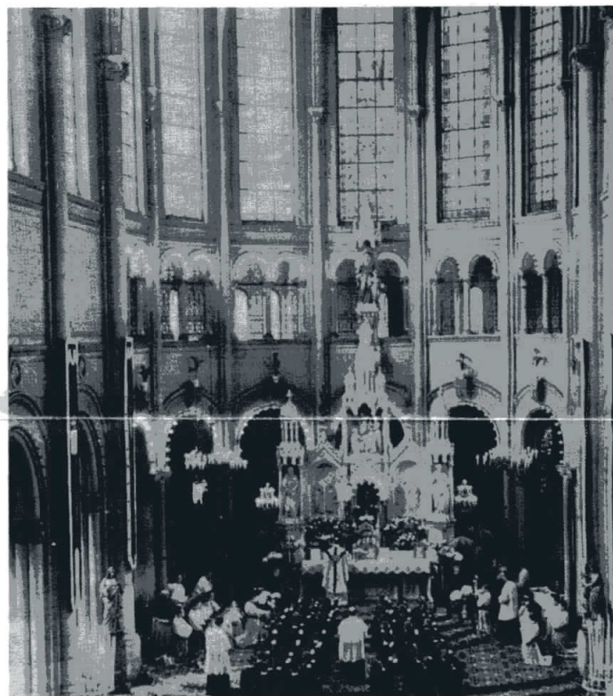
Cérémonie de communions solennelles de 1938. Cinquante ans après l'inauguration de la chapelle.