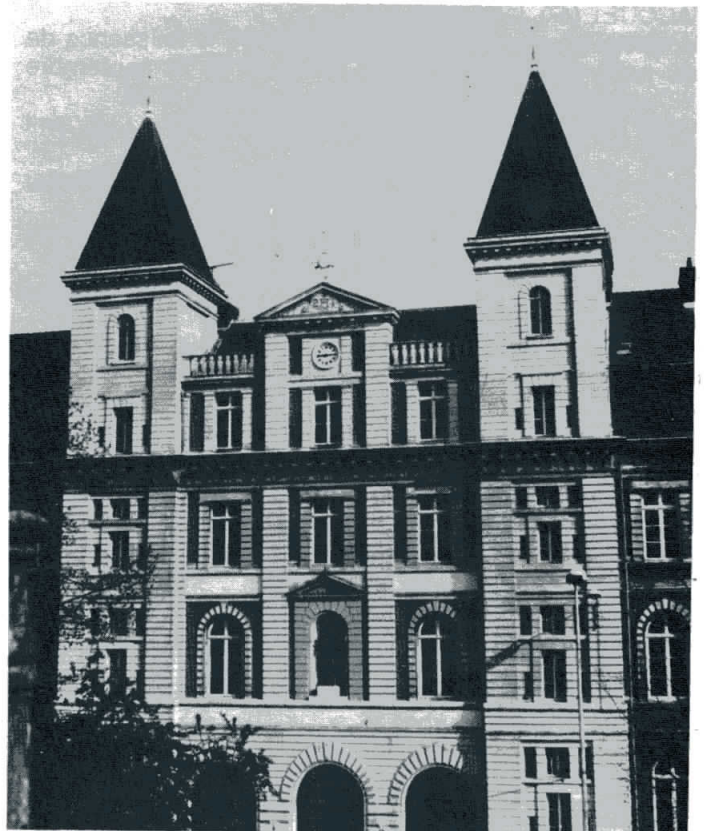
L'entrée actuelle de Saint-Paul, rue Solférino, récemment rénovée.