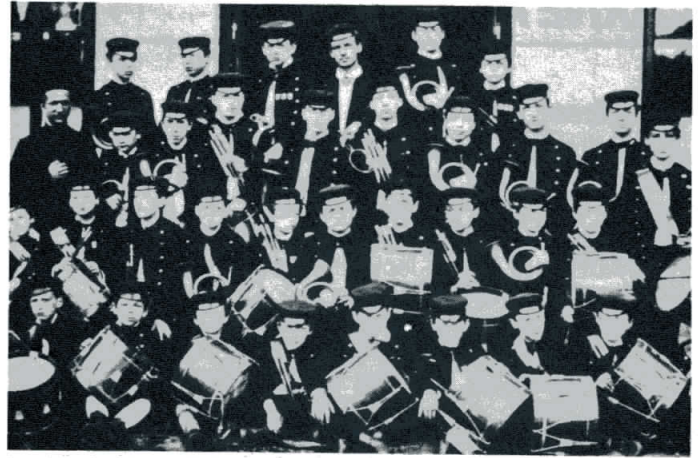
La clique fanfare de Saint-Jo.

Journée sportive, représentations de l'opéra "Joseph" de Mehul, dans la salle des fêtes, grand-messe solennelle, banquet de 1.200 couverts sous une immense tente dressée dans la cour de récréation, et revue montée et jouée par les Anciens.