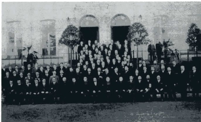
Photo de 1913 prise en face des bâtiments de l'actuelle Centrale des Oeuvres où le Collège saint-Joseph s'était retiré dans ce qui était alors un pensionnat des Frères.

Le jeudi 27 avril, les sept cents élèves de Saint-Joseph, auxquels s'étaient joints une vingtaine de nouveaux inscrits, bon nombre d'anciens et de pères de famille, se réunissaient pour la rentrée solennelle dans le nouveau Collège Notre-Dame-de-la-Treille, rue de la Monnaie, jadis pensionnat des Frères et actuellement Maison des Oeuvres.